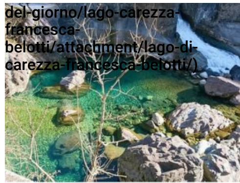
del-giorno/lago-carezza-francesca-belotti/attachment/lago-di-carezza-francesca-belotti/) ( http://www.bergamopost.it/rubriche/foto-del-giorno/lago-carezza-francesca-belotti/attachment/lago-di-carezza-francesca-belotti/ ) San Giovanni Bianco – Francesca Belotti

Archivio Foto del giorno > ( http://www.bergamopost.it/category/rubriche/foto-del-giorno/ )